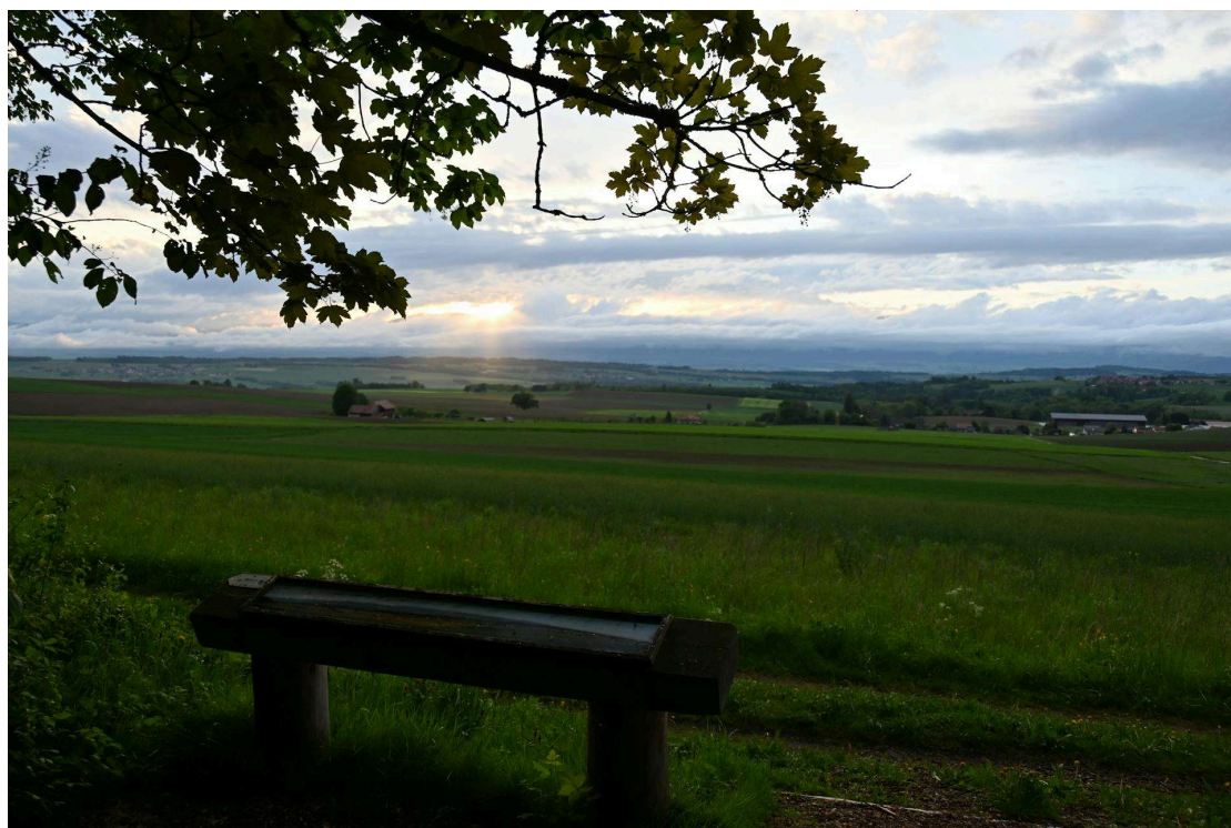
Une autre vue tout aussi incroyable, sur le Jura. Jean-Michel Zuccoli

Mais ne dévoilons pas tous les mystères des sous-bois de cette forêt qui jadis, sous l'occupation bernoise, abrita des brigands. Il paraît qu'ils hantent encore les bois, mais pour les visiteurs qui respectent le site, ils seront bienveillants à leur égard... »