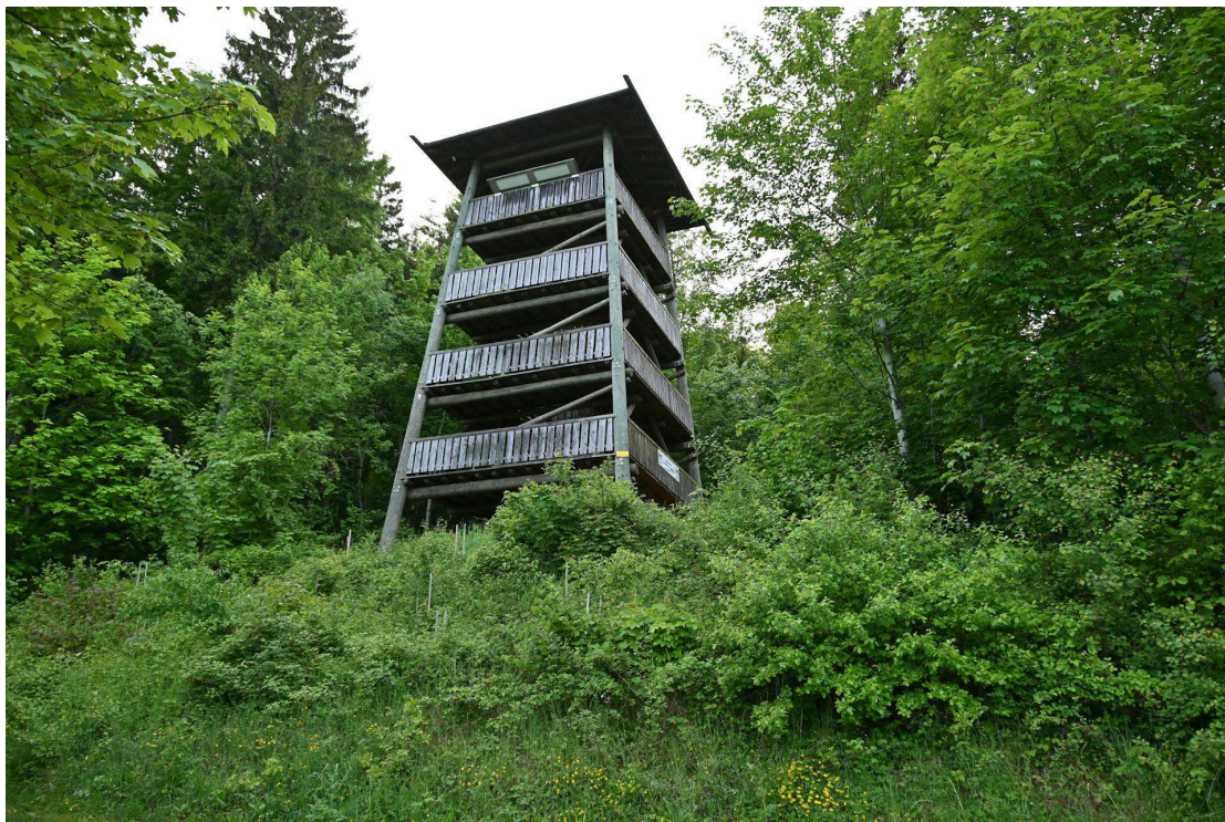
Le Donjon offre une vue incroyable sur les Alpes et la campagne. Jean-Michel Zuccoli

Trois sentiers sont proposés: celui de l'Arbre et la Fourmi, un autre intitulé Goupil et Fripouille. Sans oublier le sentier du Donjon. Ce dernier conduit à une tour en bois de 16 mètres de haut. Une soixantaine de marches pour accéder au sommet, puis la vue sur les Alpes s'offre à celui qui a fourni l'effort de les gravir. En fin de journée, la luminosité confère au paysage un charme propice à la rêverie.