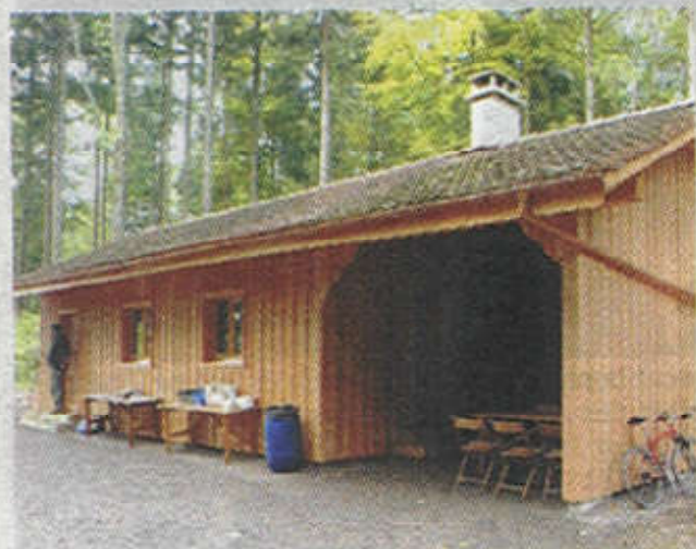
Le refuge mettra en valeur les richesses naturelles des lieux.

Un nouveau refuge forestier a vu le jour à Thierrens, au cœur d'un concept didactique dédié à l'observation de la nature.