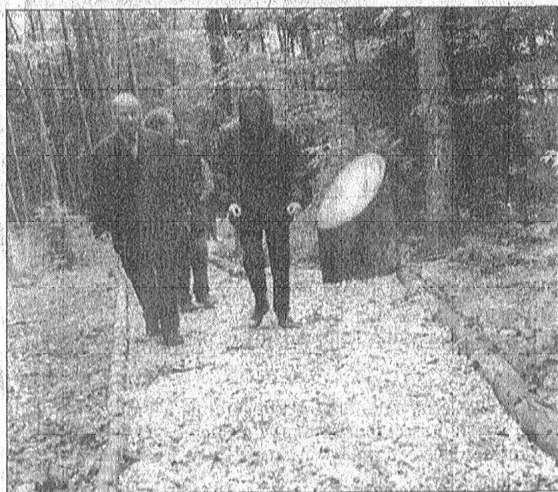
Invités, journalistes et concepteurs ont parcouru cette superbe réalisation.

Après quoi, dès 12 h 30, chacun se rendra au Bois de la Commounaille où, après la partie officielle, on sortira du sac son bol, son verre et ses couverts pour se régaler d'une soupe de chalet offerte. Dès 14 h, ce sera la découverte du sentier nature, avec les commentaires et réponses données aux questions par les forestiers du 8 e arrondissement, dont ce sera justement la journée forestière. La manifestation se terminera autour des 17 heures. (ldp)